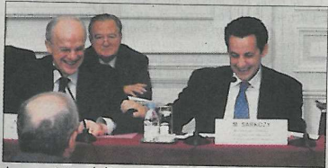
Avec un ministre de l'Intérieur devenu Président