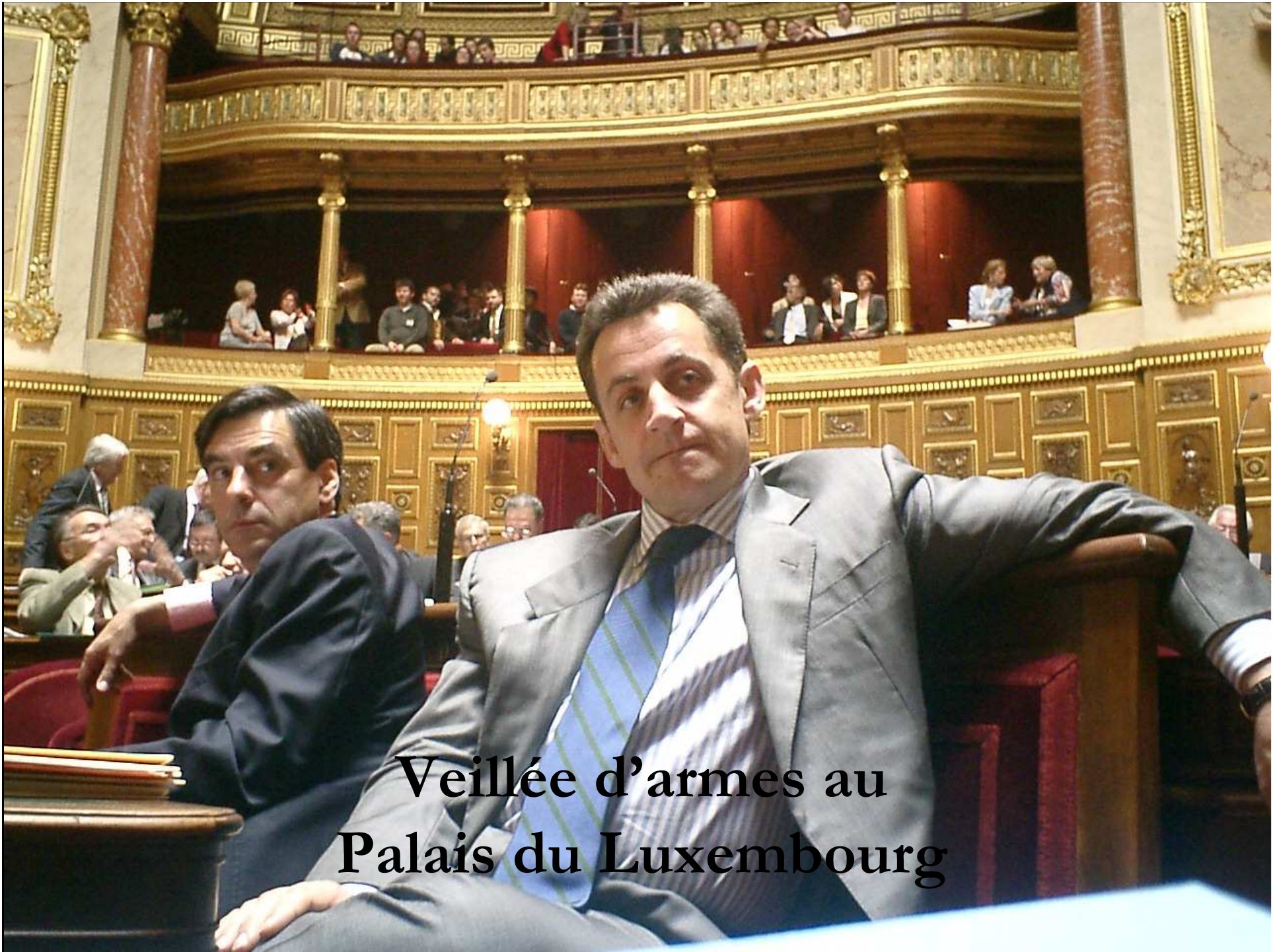
Veillée d'armes au Palais du Luxembourg